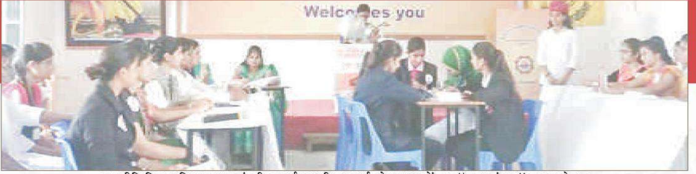
राजनीति विज्ञान विभाग द्वारा संसदीय कार्यप्रणाली ज्ञानवर्धन हेतु छात्राओं द्वारा "युवा संसद" का आयोजन