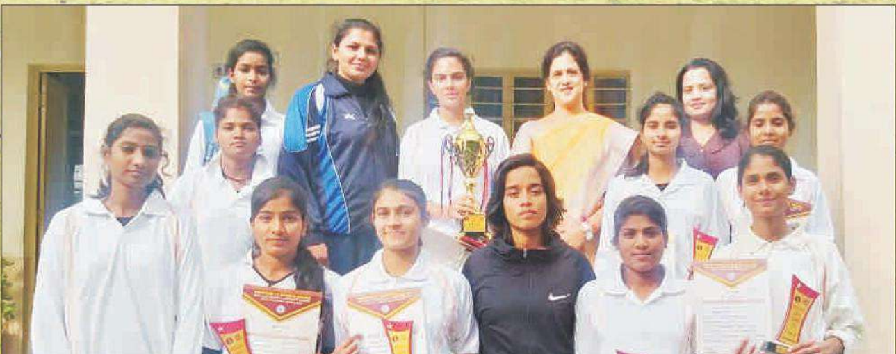
College Team received Inter Collegiate Cricket Tournament(W) Runner Up Trophy 2019