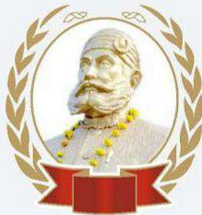
मामा महाराज अमानसिंह जी रलावता