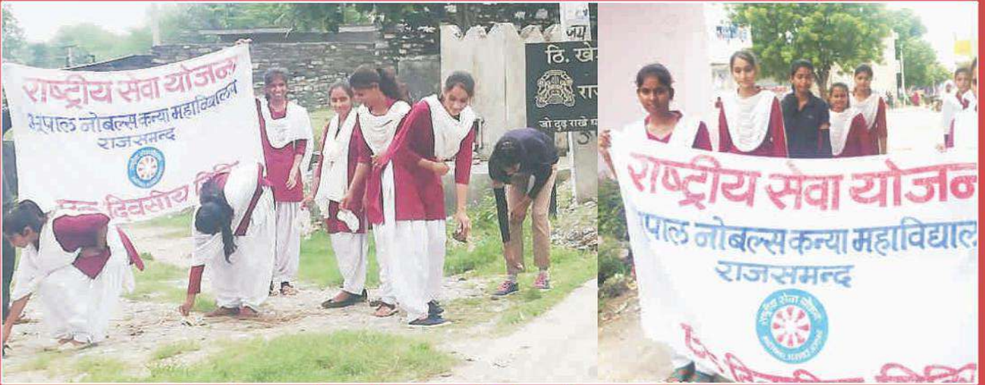
राष्ट्रीय सेवा योजना इकाई द्वारा गोद लिए गए गाँव खेडाना में जागरूकता रैली का आयोजन