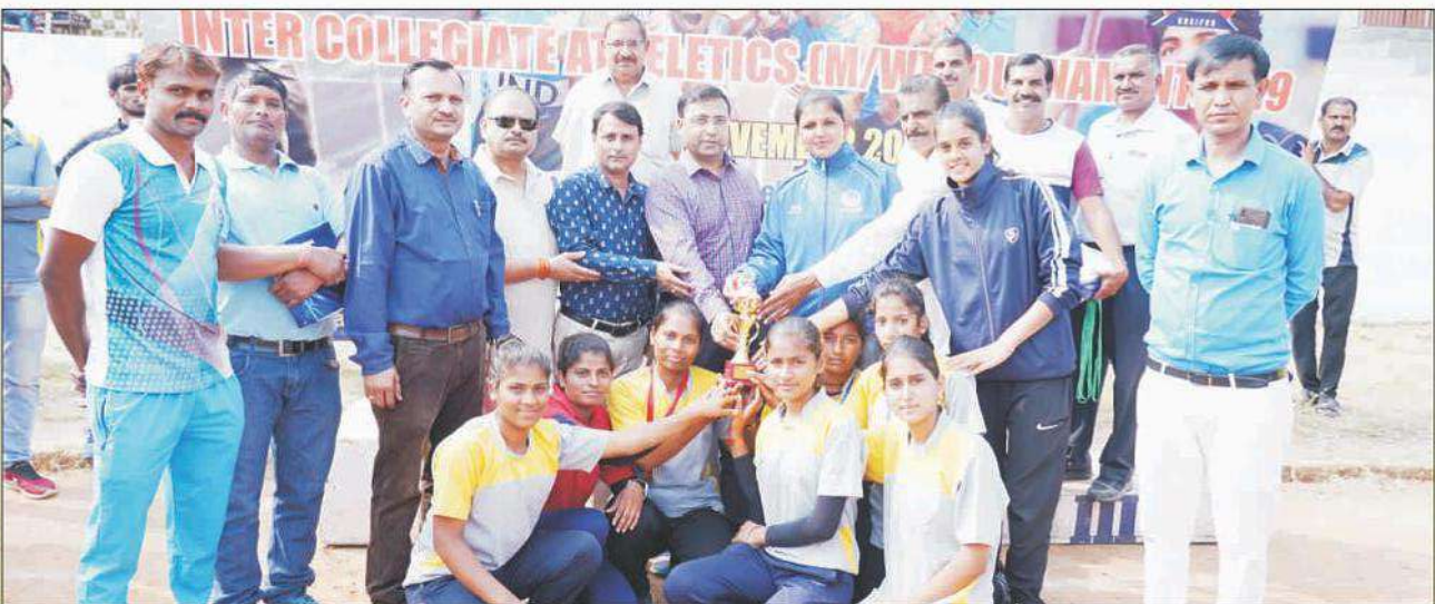
College Team received Inter Collegiate Athletics Tournament Runner(W) Up Trophy 2019