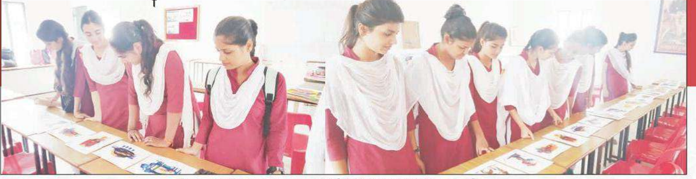
चित्रकला विभाग द्वारा कला प्रदर्शनी "संवाद 2019" का आयोजन