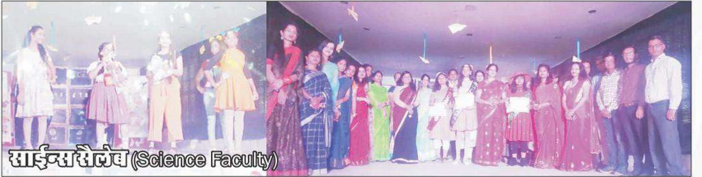
साइंससैलैब (Science Faculty)