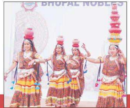
सांस्कृतिक कार्यक्रम 'मूमल' में आयोजित विभिन्न प्रतियोगिताओं में प्रस्तुति देती हुई छात्राएँ