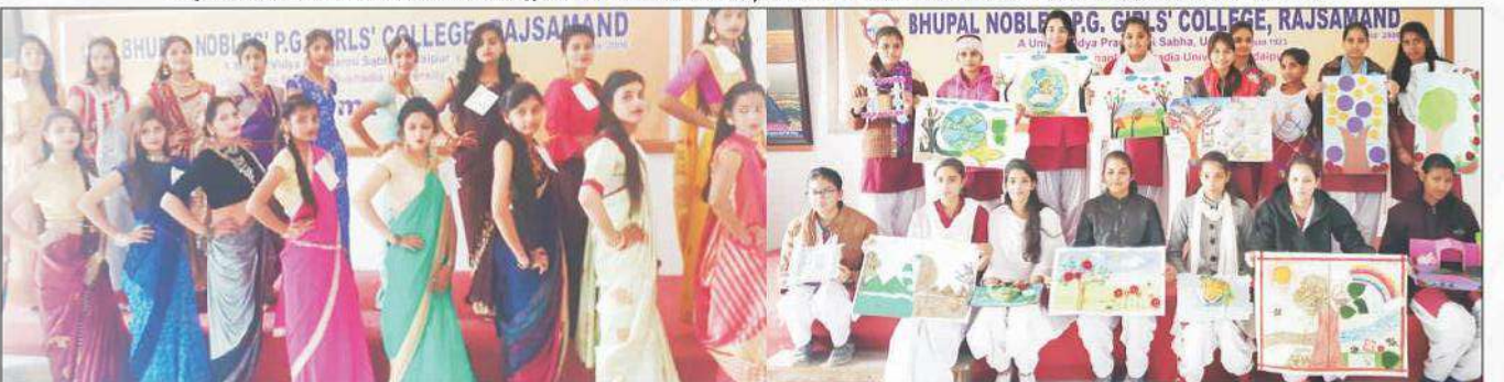
महाविद्यालय में गृह विज्ञान विभाग द्वारा साड़ी रेपिंग और कोलाज प्रतियोगिता का आयोजन