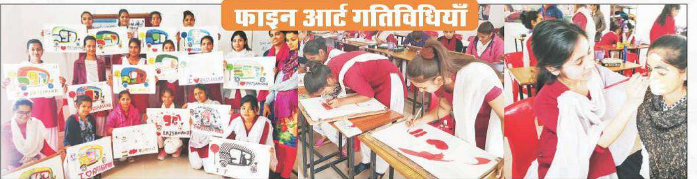
महाविद्यालय में चित्रकला विभाग द्वारा ऑन स्पॉट पेन्टिंग, पोस्टर मेकिंग और फेस पेंटिंग प्रतियोगिता का आयोजन