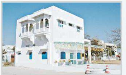
Shakti Sadan Guest House