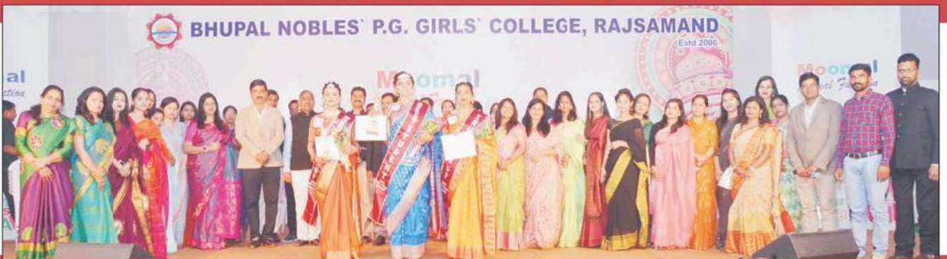
अतिथियों के साथ 'बेस्ट स्टूडेंट प्रतियोगिता' की विजेता छात्राएँ