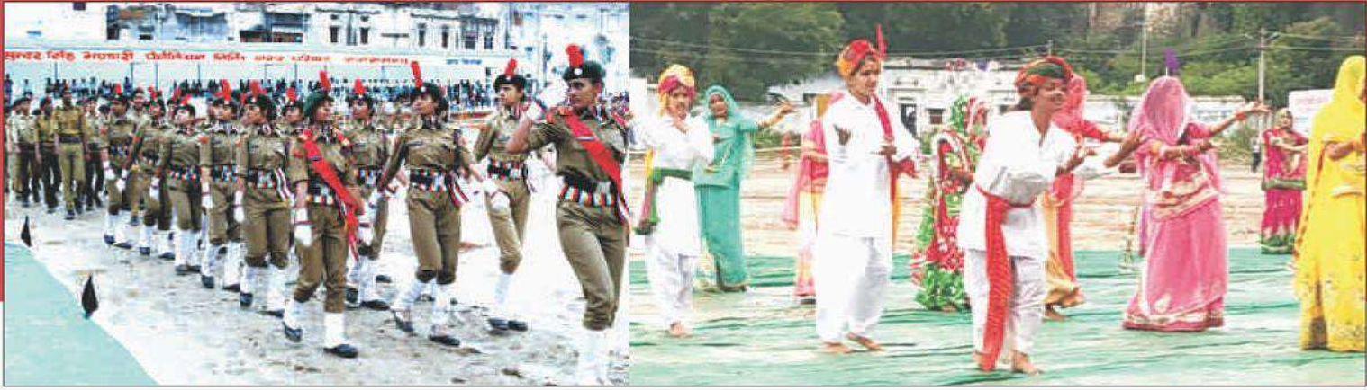
Independence Day Celebration in Balkrishna stadium in Kankroli