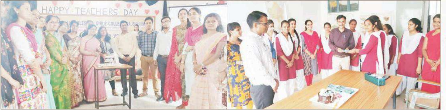
पूर्व राष्ट्रपति डॉ. सर्वपल्ली राधाकृष्णन के जन्म दिवस को 'शिक्षक दिवस' के रूप में मनाता महाविद्यालय परिवार