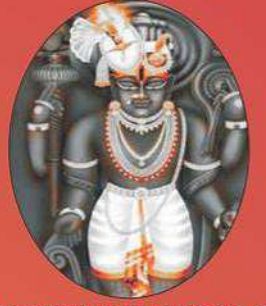
SHRI DWARKADHEESH JI