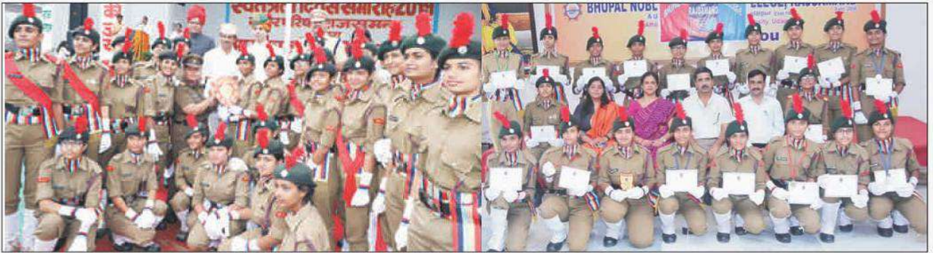
जिला स्तरीय स्वतन्त्रता दिवस समारोह में भी एन.सी.सी. कैडेट्स ने परेड प्रदर्शन में द्वितीय स्थान प्राप्त किया।