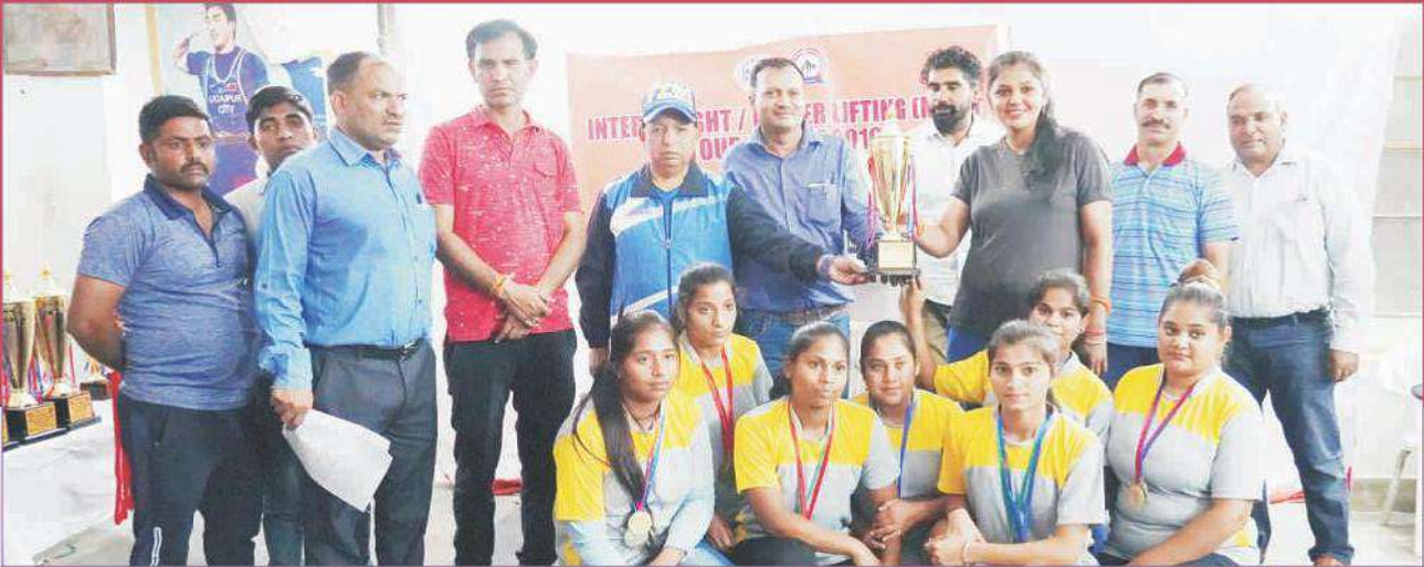
College team receiving Championship winners trophy of Inter Weight lifting(w)

The games and sports department provides facilities for participation in different activities. Regular practice sessions are conducted to enhance the sports skills among the students. The information about the practice session and trials are displayed from time to time on the college notice board. Facilities for the following events are available in the college for its students : (1) Swimming, (2) Basketball,(3) Handball, (4) Hockey(5) Cricket, (6) Kho-Kho, (7) Kabaddi, (8) Weight lifting, (9)Atheltics etc.