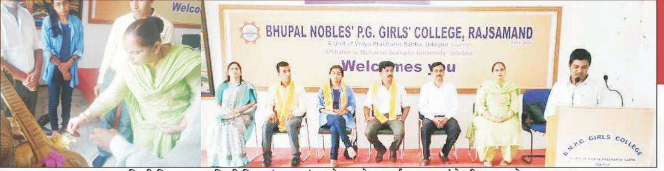
हिन्दी विभाग द्वारा हिन्दी दिवस 'सप्ताह' आयोजन के अन्तर्गत काव्य संगोष्ठी का आयोजन