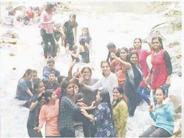
अरावली की सुरम्य वादियों में स्थित आराम बाग, उदयपुर में महाविद्यालय पिकनिक का आयोजन।