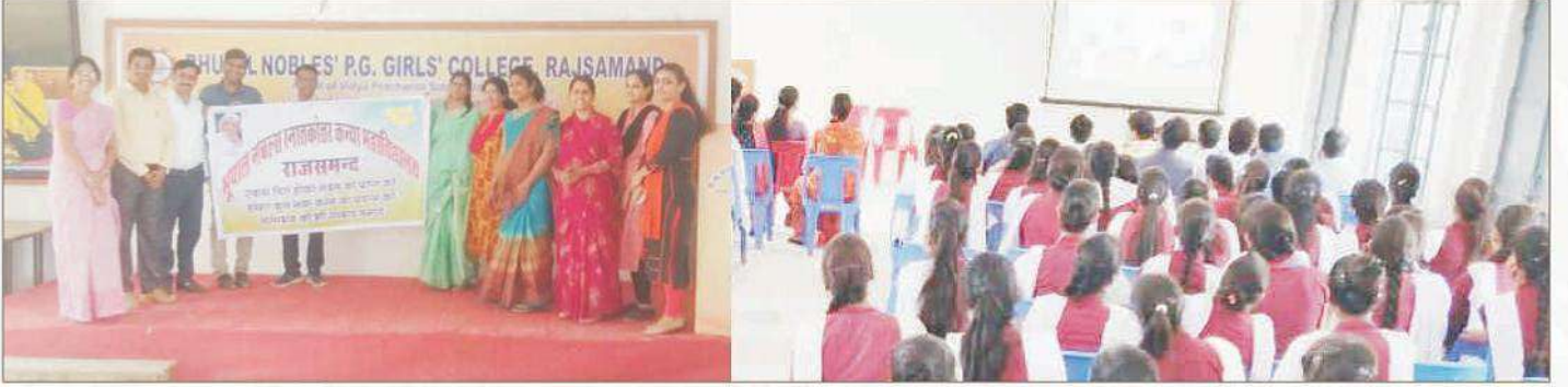
पूर्व राष्ट्रपति डॉ. ए.पी.जे. अब्दुल कलाम के जन्म दिवस को 'स्टुडेंट डे' के रूप में मनाता महाविद्यालय परिवार