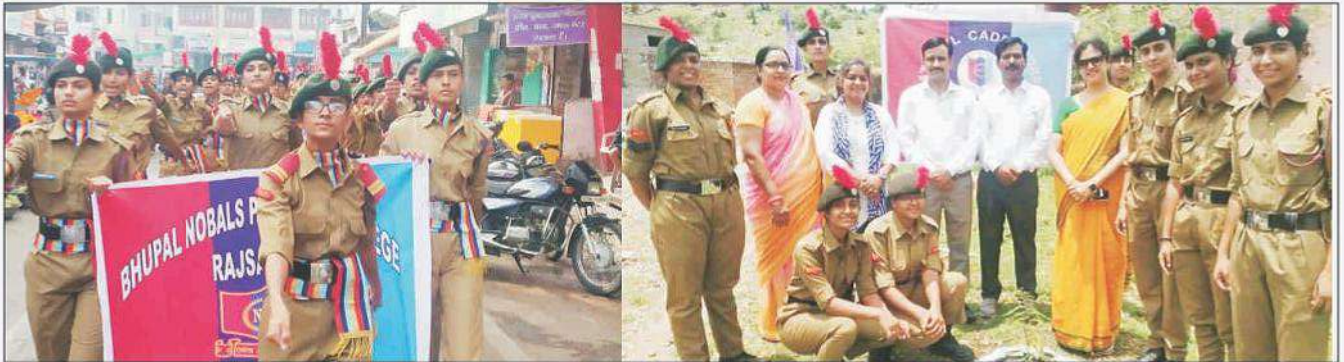
एन.सी.सी. कैडेट ने एन.सी.सी. दिवस पर जिले में रैली निकालकर लोगों की देशभक्ति, महिला सशक्तिकरण, स्वच्छता, पर्यावरण के प्रति जागरूक किया।