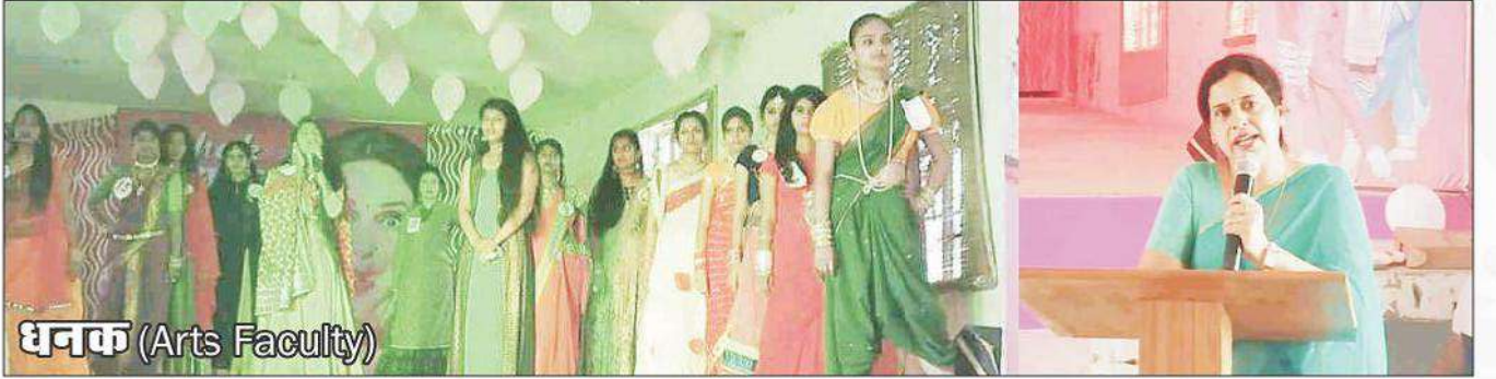
धनक (Arts Faculty)