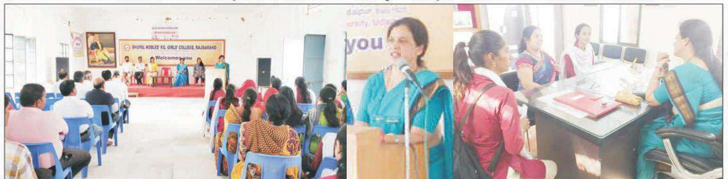
उच्च शिक्षा में गुणवत्ता अभिवृद्धि हेतु अभिभावक प्राध्यापक संवाद का आयोजन