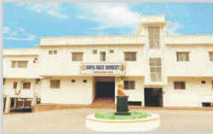
University Administrative Block