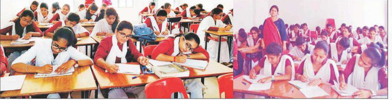
महाविद्यालय में अंग्रेजी विभाग द्वारा Essay Writing, Slogan Writing, Hand Writing प्रतियोगिता का आयोजन