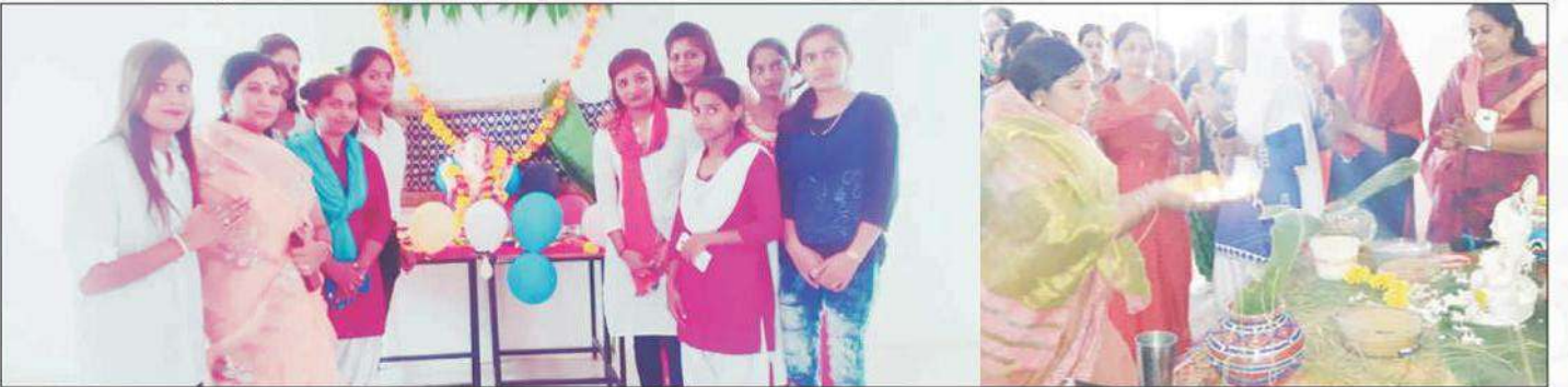
महाविद्यालय में गृह विज्ञान विभाग द्वारा गणेश चतुर्थी और कृष्ण जन्माष्टमी का आयोजन