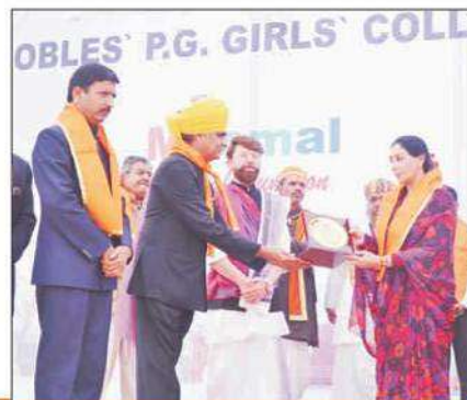
माननीया सांसद दीयाकुमारी जी का संस्थान के मंत्री महोदय, प्रबंध निदेशक महोदय और प्राचार्या महोदया द्वारा स्वागत माननीया सांसद दीयाकुमारी जी का उद्बोधन एवं छात्राओं को पुरस्कार वितरण एवं स्मृति चिह्न भेंट