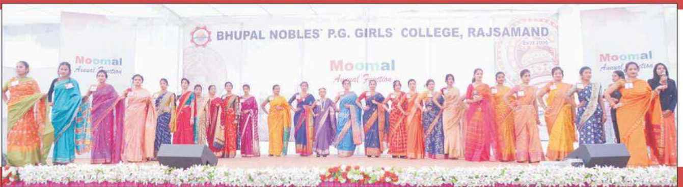
सांस्कृतिक कार्यक्रम 'मूमल' में 'बेस्ट स्टूडेंट प्रतियोगिता' में प्रस्तुति देती हुई छात्राएँ