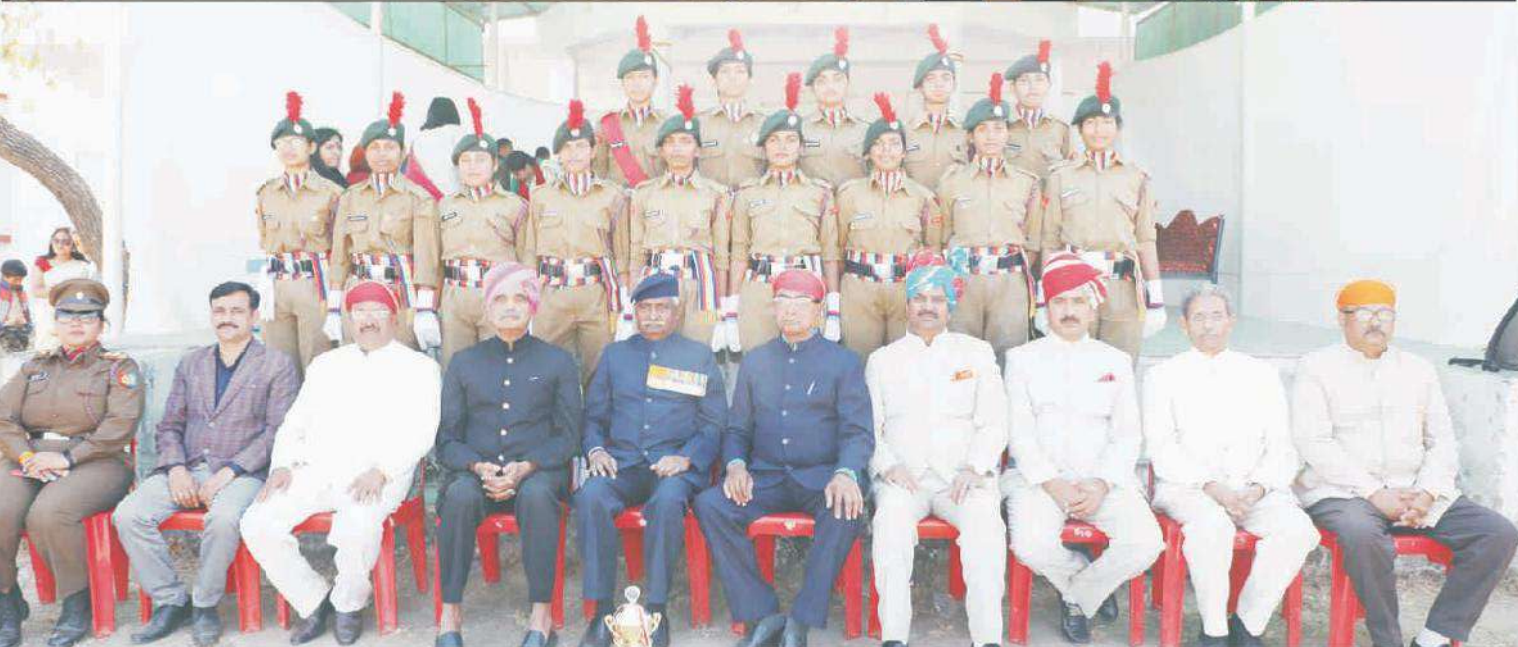
Republic Day Celebration at parent institute B.N.Campus, Udaipur